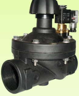
1-1/2" चा सॉलेनॉईड वॉल्व फ्लो अँडजेस्टर सह