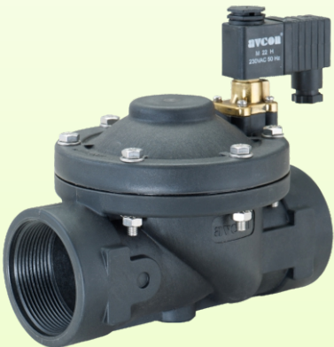
1" चा सॉलेनॉईड वॉल्व