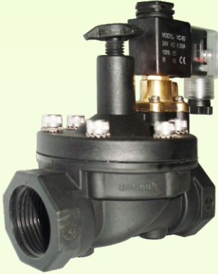
3/4" चा सॉलेनॉईड वॉल्व फ्लो अँडजेस्टर सह